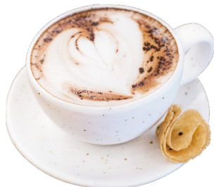
កាហ្វេម៉ូកា Mocha