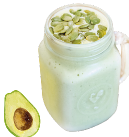
ផ្លែប៉េក្រឡុក Avocado Smoothie 3,5