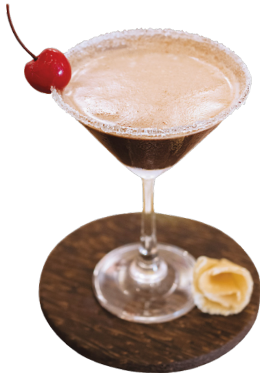
Sweet to Sweet Baileys, Kahlúa & dark chocolate sauce 4,5