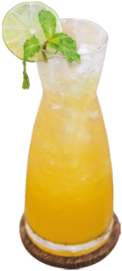
យុសុ តែក្រូចឆ្មារ / សូដា Yuzu Iced Tea / Soda 2,75