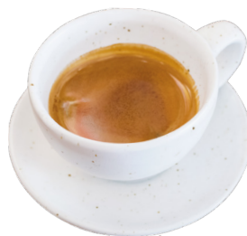
ដប់បល់ឆេសត្រៃសសូ Double Espresso