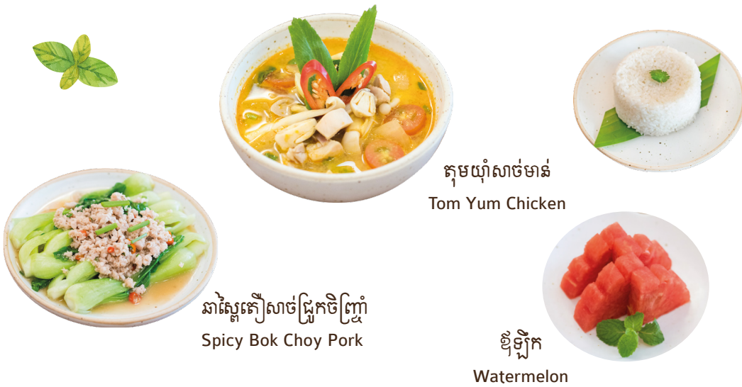
តុមយ៉ាំសាច់មាន់ Tom Yum Chicken