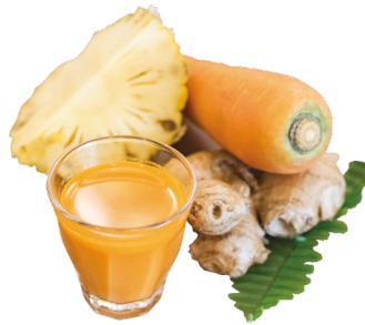
ទឹកខ្ចី Spicy Ginger Juice 3,5