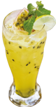
ជាសសិន ទឹកដោះគោ / សូដា Passion Fruit Milk / Soda 2,75