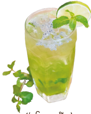
តែក្រូចឆ្មារជ័រអង្កាម Minty Lime Iced Tea 2,5