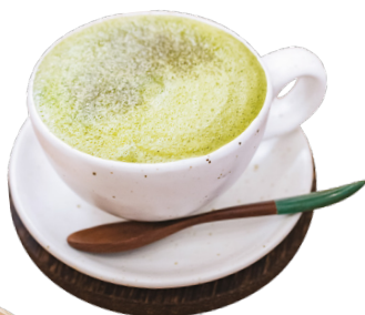
ម៉ាតាឡាតេ Matcha Latte