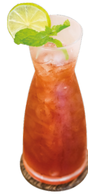
ព្រែកឃីរ តែក្រូចឆ្មារ / សូដា Cranberry Iced Tea / Soda 2,75