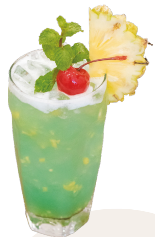
Tropical Ocean Vodka, Malibu, Blue Curaçao, simple syrup, pineapple & lime juice 4,5