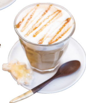
ឡាតេក្តៅ Hot Latte