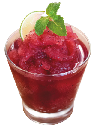
Blueberry Frost Vodka, cointreau, blueberry, lime juice & simple syrup 4,5