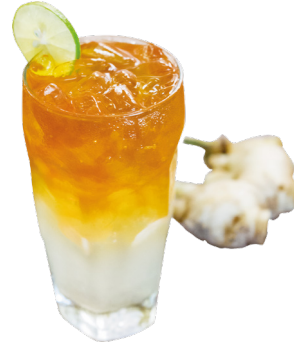
តែខ្ចីទឹកឃ្មុំ Honey Ginger Iced Tea 2,5