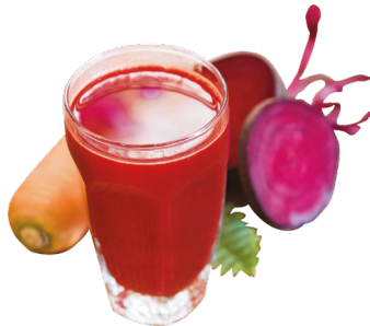
ឆៃថាវក្រហមការ៉ុត Beetroot Carrot Juice 3,5