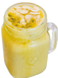
ជាសសិនចេកក្រឡុក Passion Banana Smoothie 3,5