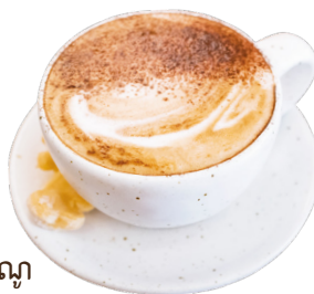
កាហ្វេជីណូ Cappuccino