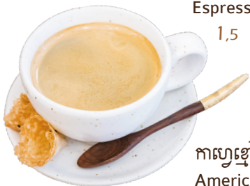
កាហ្វេខ្មៅក្តៅ Americano