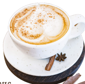
កាហ្វេស៊ីណាមន Cinnamon Coffee