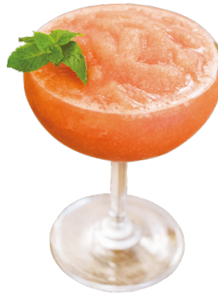
Papaya Daiquiri Rum, Triple Sec, papaya, lime, simple syrup 4,5