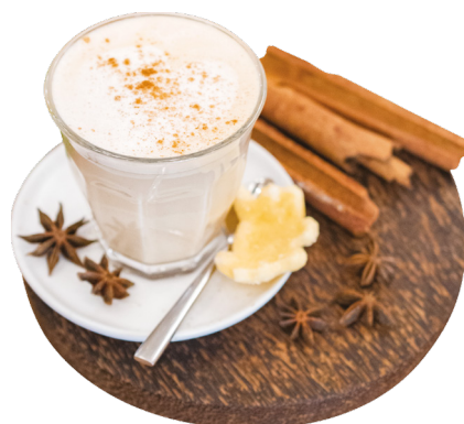
តៃឆាយទឹកដោះគោ Hot Chai Latte