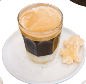
កាហ្វេផ្អែម Hot Sweet Milk Coffee