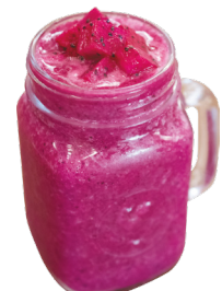
ផ្លែស្រកាណាតក្រឡុក Dragon Fruit Smoothie 3,5