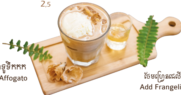
សែមប្រេនដេលីកូ Add Frangelico 0,5