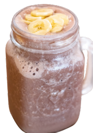
ស្ករក្រឡុកចេកក្រឡុក Chocolate Banana Smoothie 3,5