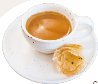
ឆេសត្រៃសសូ Espresso