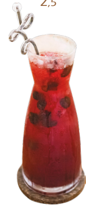
ប៊ូប៊ឺរី តែទឹកឃ្មុំ / សូដា Blueberry Honey Tea / Soda 2,75