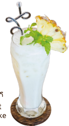
ដូងក្រឡុក Coconut Milk Shake 3