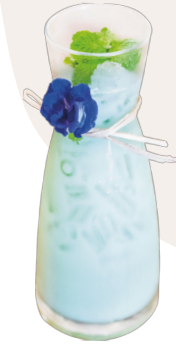
តែរសជាតិដូង Coconut Mint Iced Tea 2,5