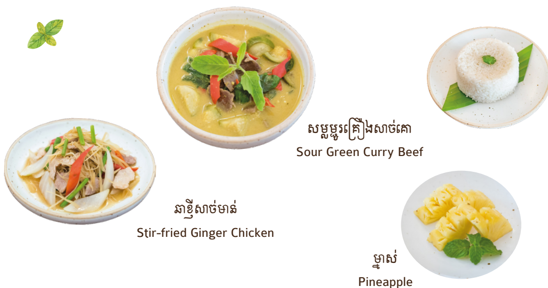
សម្លម្លូរគ្រឿងសាច់គោ Sour Green Curry Beef