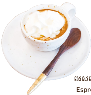
ឆេសត្រៃសសូក្រែម Espresso Cream