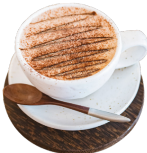
ស្ករក្នុងក្តៅ Hot Chocolate