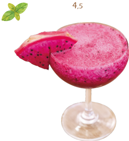
Dragon Fruit Daiquiri White rum, triple sec, dragon fruit, lime juice & simple syrup 4,5