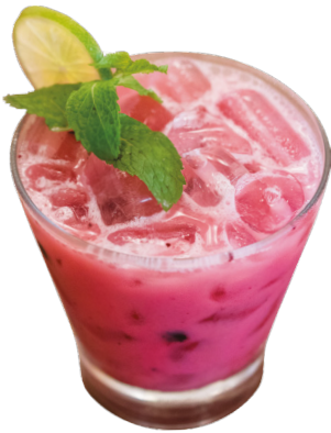
Blueberry Coconut Rum, blueberry, coconut liqueur, coconut milk, lime & honey 4,5