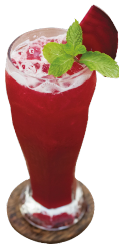
Red Ruby Gin, Beetroot Juice, Mint lime, simple syrup & Soda 4,5