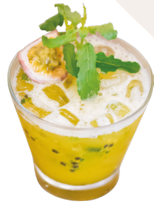
Passion Fruit Gimlet Gin, passion fruit, holy basil, lime juice & simple syrup 4,5