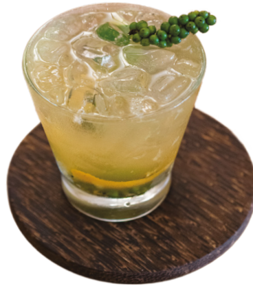
Kompot Pepper Cocktail Whiskey, peppercorns, tonic, lime wedges, orange twist & simple syrup 4,5