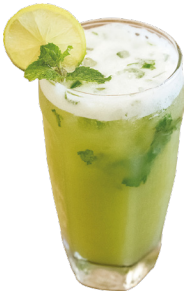
ទឹកត្រសក់ខ្ចី Cucumber Ginger Cooler / Juice 3,5