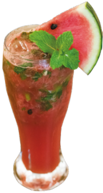
ទឹកឌីឡឹកក្រូចឆ្មារ Watermelon Iced Tea 2,5